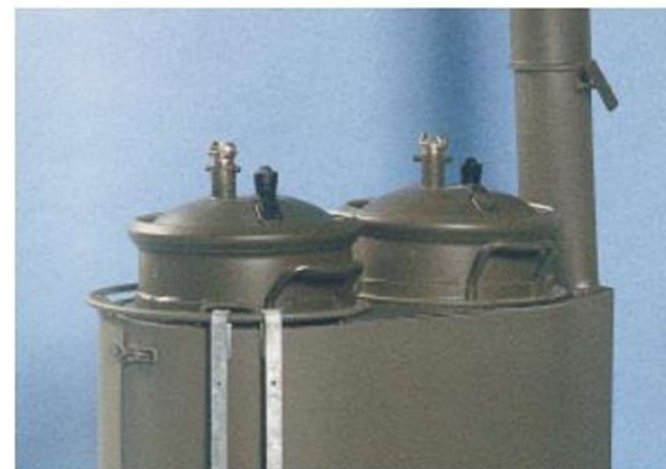
Bild 41. Kokspis 102 med två tryckkokkittlar